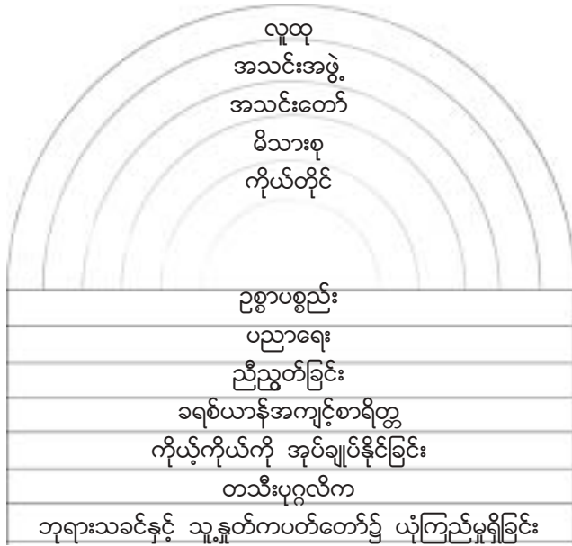
ပုံစံ ၁။ ခရစ်တော်လူမျိုးများကို ထောက်ပံ့သော အခြေခံမူများ

ထောက်ပံ့ခြင်းလည်း မရှိလျှင် လျန်မြန်စွာ ပျက်စီးကြရလိမ့်မည်။ ၎င်းအခြေခံအုတ်မြစ်ကို ကျမ်းစာထဲမှာ တွေ့ရသော အခြေခံမူဖြင့် ဖွဲ့စည်းထားသည်။ ပုံစံ (၁) တွင် လူ့အဖွဲ့စည်း ထဲတွင်ပါဝင်သော အစိတ်အပိုင်းများကို အခြေခံအုတ်မြစ်နှင့်တကွ လှေကားထစ်သဖွယ် ဖော်ပြပြီး လိုအပ်သောလွတ်လပ်ရေး၊ တရားမျှတရေး၊ ကြီးပွားတိုးတက်ရေးနှင့် လူမျိုးကြာရှည် တည်တံ့ခိုင်မြဲနိုင်ရေး အတွက် ထောက်ပံ့ပေးမှုကို ပုံများဖြင့် ရှင်းပြ ထားသည်။